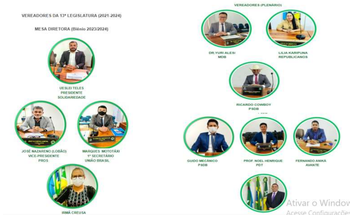
Estrutura da câmara municipal